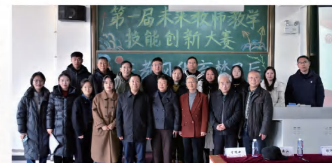
未来教师技能大赛