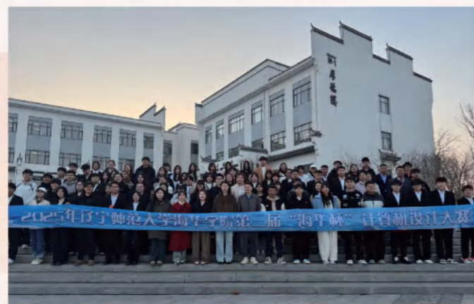
第三届海华杯设计大赛