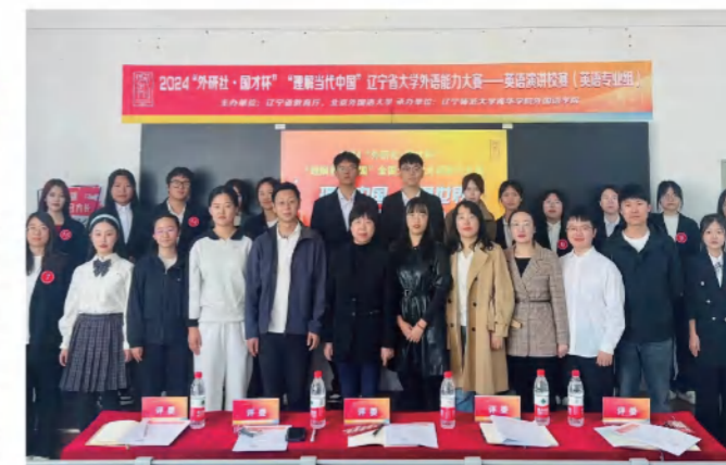
2024外研社·国才杯“理解当代中国”辽宁省大学外语能力大赛—英语演讲校赛（英语专业组）

日语专业致力于培养具备扎实日语语言基础、跨文化交际能力和创新思维的复合型人才。在新文科建设背景下，专业主干课程包含基础综合日语、日语听力、日语阅读、日语会话等，同时融合语言学、文学、商务学等多学科知识，构建多元化的课程体系。专业积极开展国际交流与合作，与多所日本高校建立合作关系，拓宽学生国际视野。毕业生具备扎实的日语语言基础、跨文化交际能力和国际视野，能够在教育、商务、翻译等领域胜任多种工作。