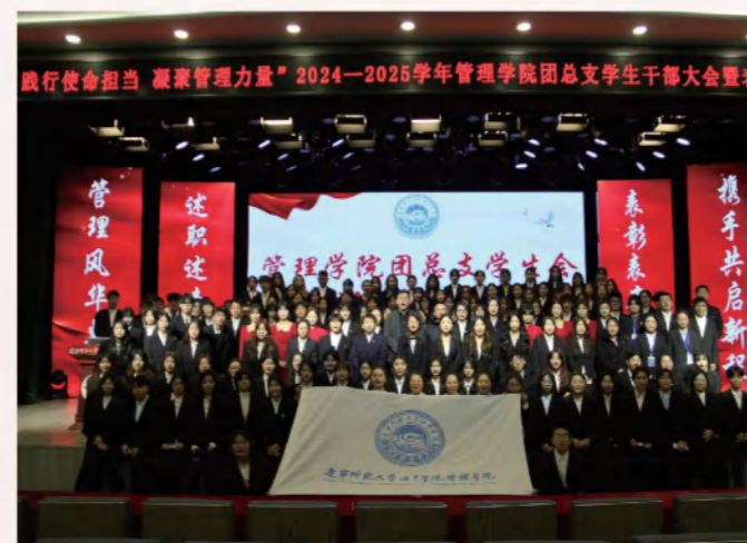
管理学院团总支学生代表大会

培养目标及主要课程：本专业培养有理想信念、奋斗奉献精神，具扎实图书馆学、情报学基础，擅长文献组织、信息咨询与管理，有服务意识、管理与创新能力的人才，能在各类图书馆、档案馆及信息机构，用专业技能解决文献管理、智慧服务等问题，服务文化传播事业与知识普惠，适配现代信息服务行业需求。图书馆学概论、情报学基础、图书馆自动化、信息检索、数字图书馆建设、管理学概论、信息描述、文献计量学、信息经济学、信息资源编目等。