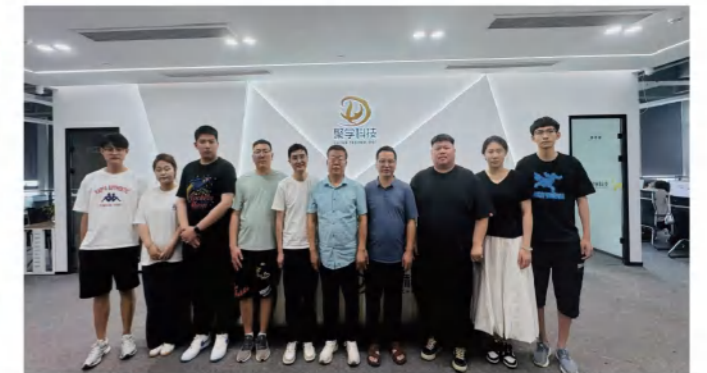
聚学科技访企拓岗行动