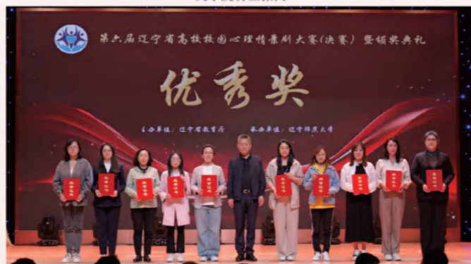
学生省级比赛获奖