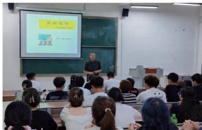
数学建模协会活动

数学科学学院遵循“以学生为中心、以能力为重点、以产出为导向”的办学理念，致力于培养具有扎实理论基础、较强实践能力、强烈社会责任感的高素质应用型人才。学院将“产教融合、实践先行”作为办学特色，学院与浙江聚新汽车电子有限责任公司、中国民生银行庄河支行等许多企业建立深度合作关系，共同打造高水平实践基地。学院大力推动专业交叉融合，数学专业与数据科学与大数据技术专业共同建立数学建模协会，数据科学与大数据技术专业与环境设计专业共同建立大数据艺术文创活动中心，鼓励学生打破学科壁垒，形成了“交叉广泛、催生创新”的学科优势。经过多年努力，人才培养成果显著。在各类高水平学科竞赛、创新创业大赛中，我院学子屡获佳绩。