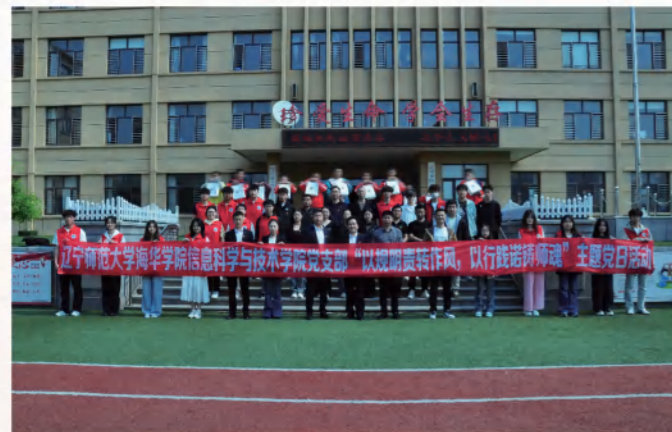
信息科学与技术学院党支部主题党日活动

学院与华为、浙江达峰科技集团、东软集团、中软集团等知名企业深度合作，建立校外实习实训基地，通过“教学—实践—实训”一体化培养模式，强化学生实战能力与专业素养，致力于培养德智体美劳全面发展、具备创新精神与工程实践能力的高级复合型应用人才，为信息科技领域输送优质专业人才。