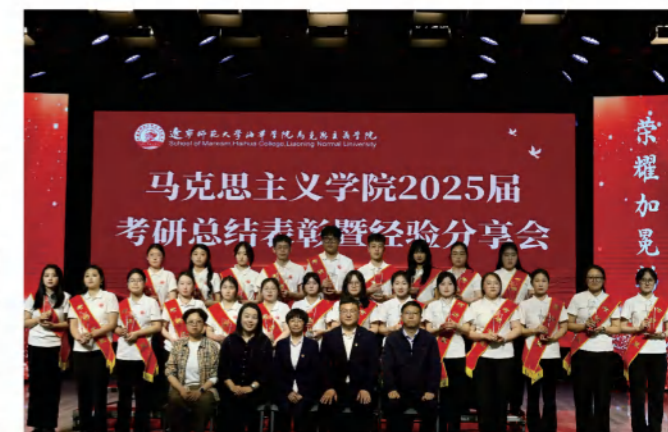
25届考研表彰合影留念

专业开设了马克思主义哲学、马克思主义政治经济学、科学社会主义、习近平新时代中国特色社会主义思想概论的等15门核心课程，涵盖政治学、马克思主义理论、教育学等多个学科方向；学院开设三字”训练、爱国主义教育实践、礼仪与修养、演讲与口才、思想政治教育教学技能训练、思想政治教育业实践综合、认知实习、专业实习、毕业设计（论文）等9门特色实践课。以上课程开设满足学生从事教师行业、党政机关工作、新闻宣传等工作的需求。