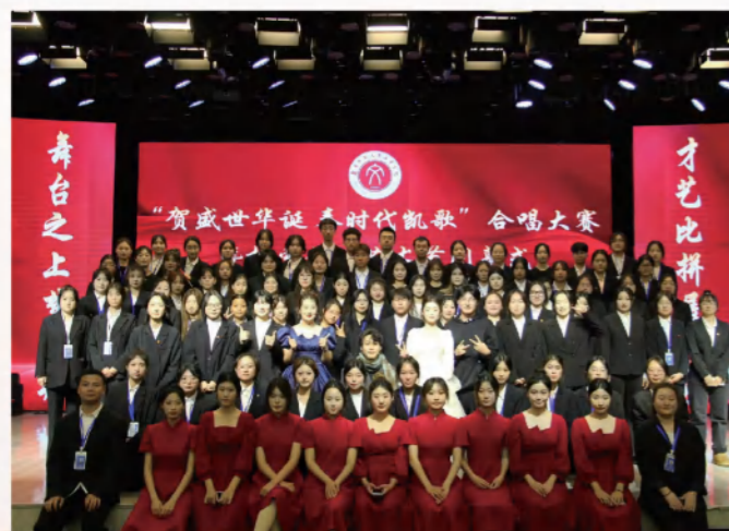
“贺盛世华诞 奏时代凯歌”大合唱比赛

学院与用友新道合作成立了“数智财经产业学院”，建设了现代化虚拟仿真实训中心，使学生在虚拟环境下体验企业真实的工作氛围，把企业搬进了课堂。学院还成立了“学科竞赛协会”“1+X职业技能协会”，让学生走出去，参加各种学科竞赛，从而达到“以赛促学”的目的，积极鼓励引导学生考取初级会计证等职业技能证书，以此提高学生的就业竞争力，通过多年的努力，形成了一套复合型、应用型，高素质人才培养模式，大大提高了人才培养质量。