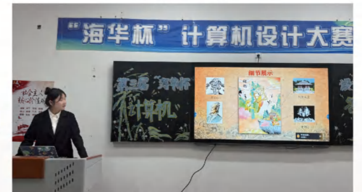
海华杯计算机设计大赛答辩