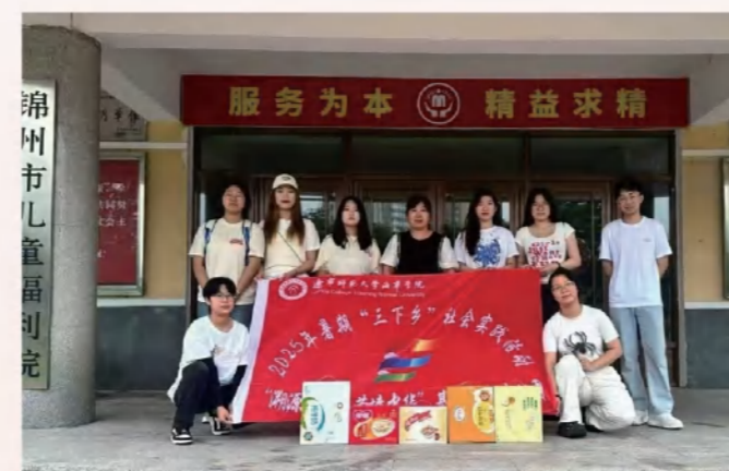
2025年暑期“三下乡”社会实践活动