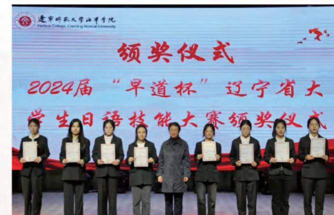
2024届“早道杯”辽宁省大学生日语技能大赛颁奖仪式