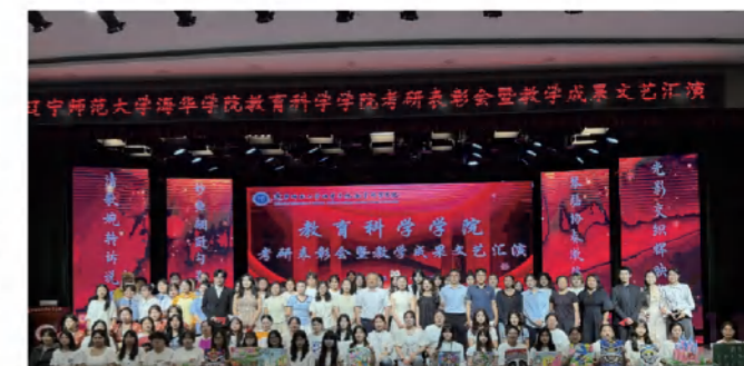
教育科学学院教学成果汇演

学院注重培养学生幼儿园活动设计的基本教学技能，同时强化钢琴、美术、舞蹈、声乐等艺术技能在幼教场景中的应用。依托与北京、沈阳、大连等地优质幼儿园的合作，为学生提供充足实习机会，助力其积累丰富实操经验。