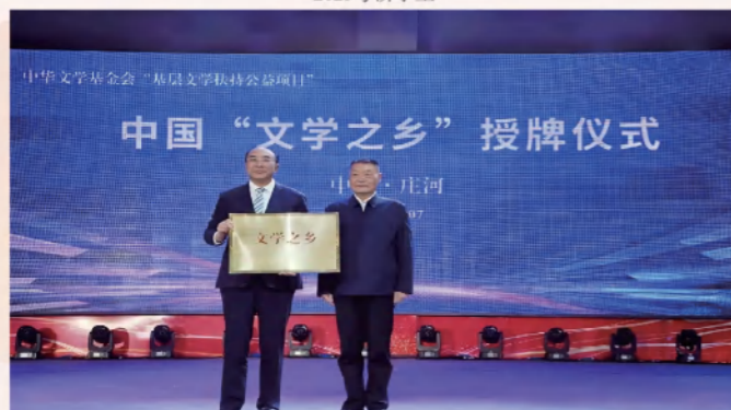
辽宁省庄河市创建全国“文学之乡”（东北首家）。