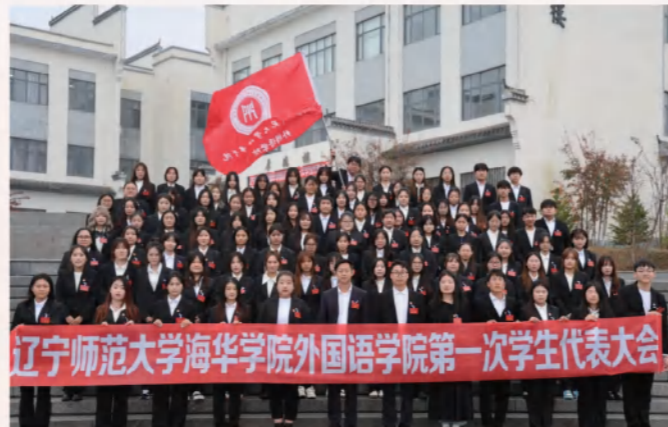
辽宁师范大学海华学院外国语学院第一次学生代表大会