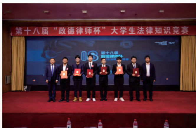
法学院学子在第十八届“政德律师杯”大学生法律知识竞赛中取得佳绩