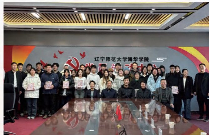
信息科学与技术学院考研指导慰问会