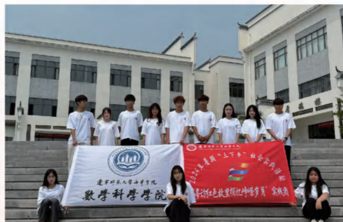
“三下乡”暑期社会实践