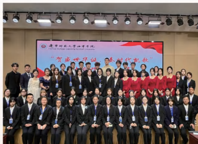
“贺盛世华诞 奏时代凯歌”大合唱比赛