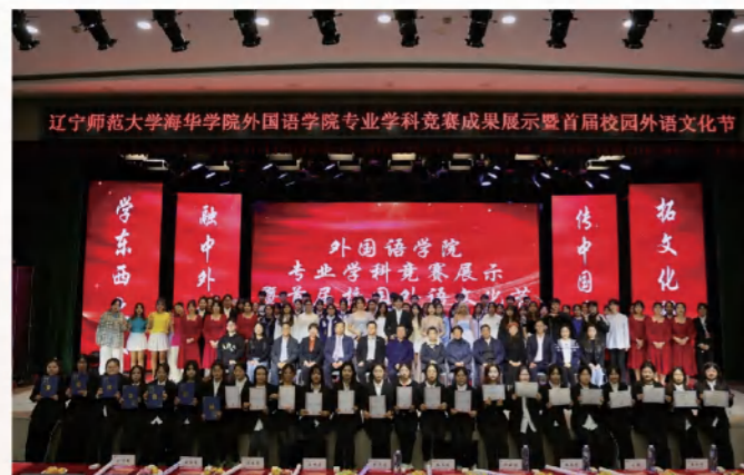
辽宁师范大学海华学院外国语学院专业学科竞赛成果展示暨首届校园外语文化节

学院秉持外语新文科特色，构建多元化的课程架构，培养学生综合运用多学科知识解决实际问题的能力。在人才培养模式上，学院积极践行OBE教学理念，以学生学习成果为导向，精准设计课程目标与教学环节。从入学到毕业，全程跟踪学生的学习进度与能力提升，依据社会需求与行业标准，动态调整教学内容与方法，确保学生毕业后能无缝对接国际交流、外语教育、涉外商务等多元职业领域，成为适应新时代发展的外语复合型精英。