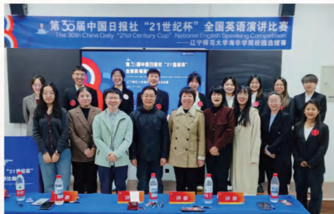
第30届中国日报社“21世纪杯”全国英语演讲比赛