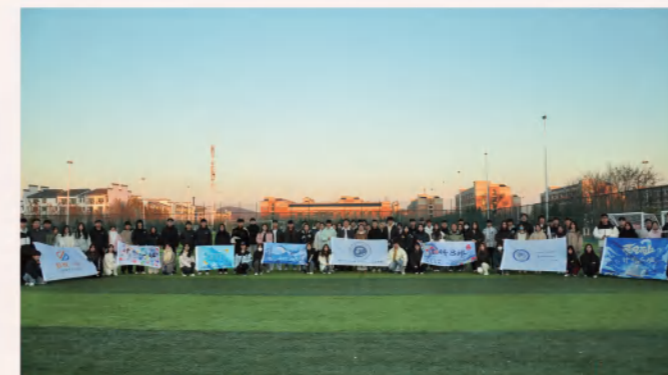
全体班级学生干部素质拓展

主干课程有C语言、数据结构、计算机图形学、数字视音频处理、游戏开发等。毕业生可从事影视制作、游戏设计开发、互联网与移动应用开发、网络与新媒体等领域工作。