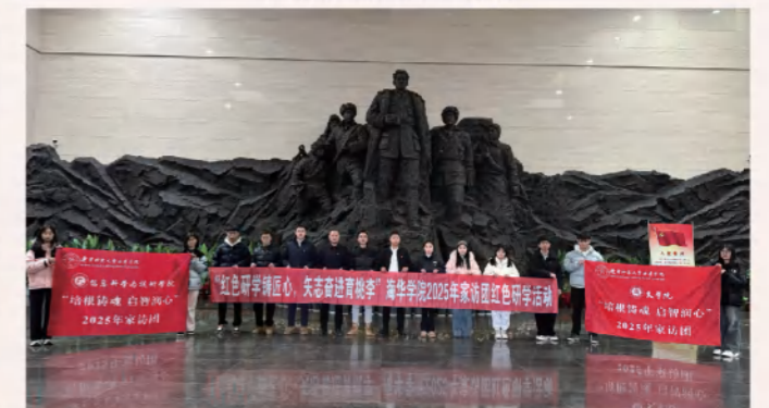
赵尚志纪念馆红色研学活动