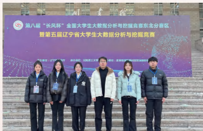
第八届“长风杯”全国大学生大数据分析与应用竞赛