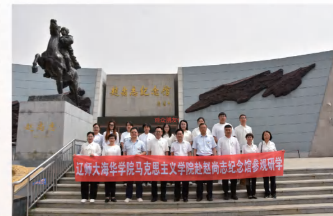
马克思主义学院教师到赵尚志纪念馆进行红色研学