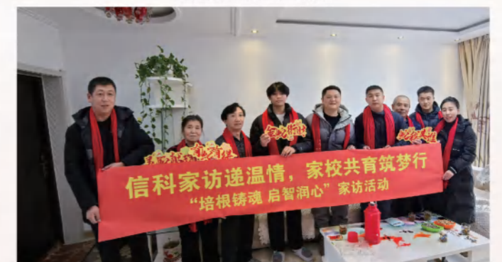
培根铸魂、启智润心-家访活动