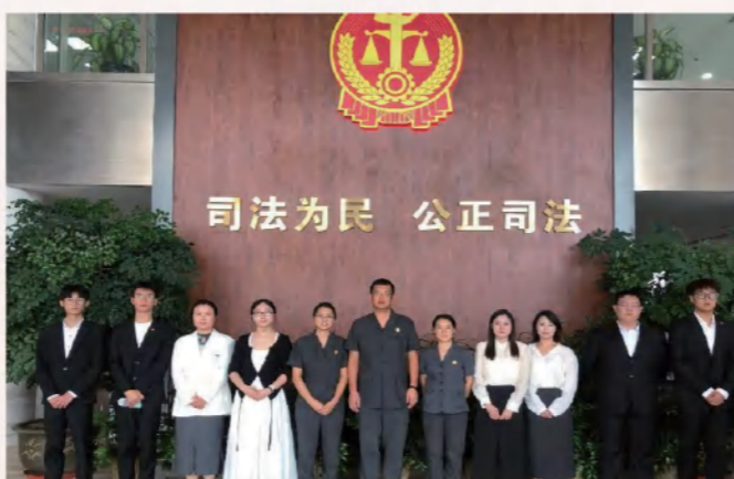
法学院组织学生赴郑州市人民法院参观学习