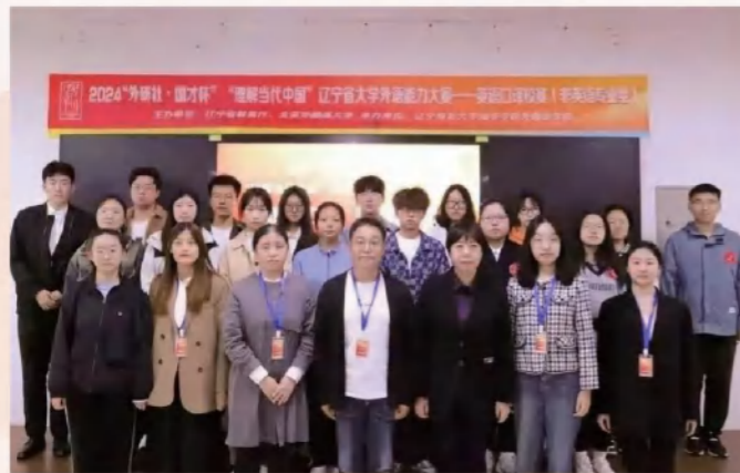
2024“外研社·国才杯”“理解当代中国”辽宁省大学外语能力大赛—英语口语校赛（非英语专业组）