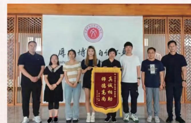
言传身教，彰显师者本色