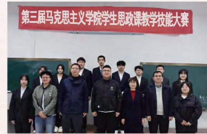
第三届马克思主义学院学生思政课教学技能大赛