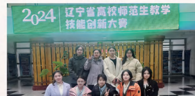
辽宁省高校师范生教学技能创新大赛获二等奖三名、三等奖两名