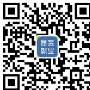
昆明医科大学就业指导中心公众号