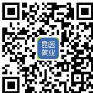
昆医就业微信公众号