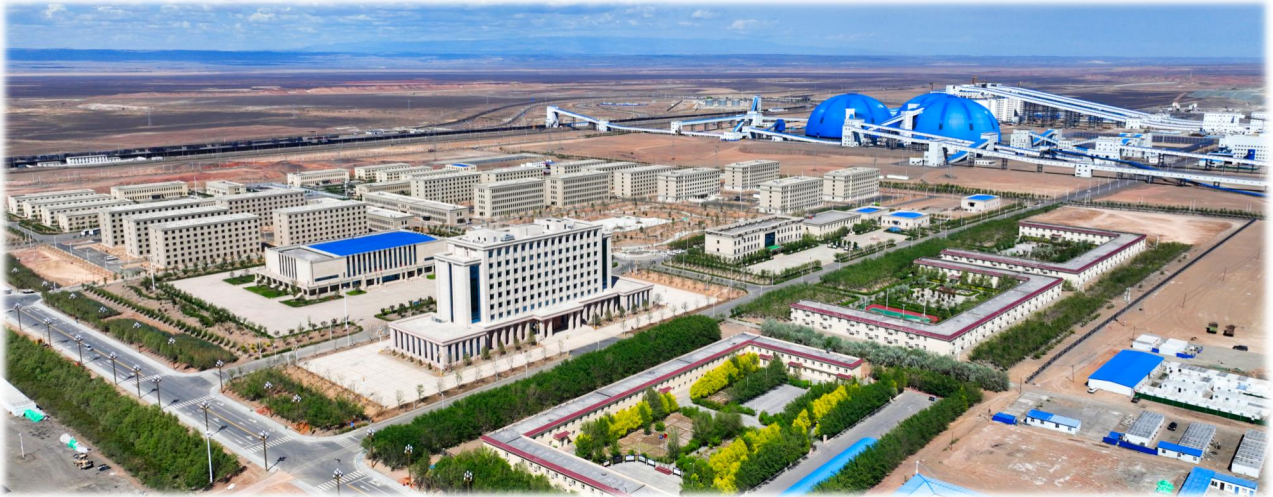
上图：将军戈壁二号露天煤矿园区全景图