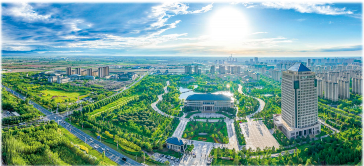
上图：特变电工总部科技研发基地