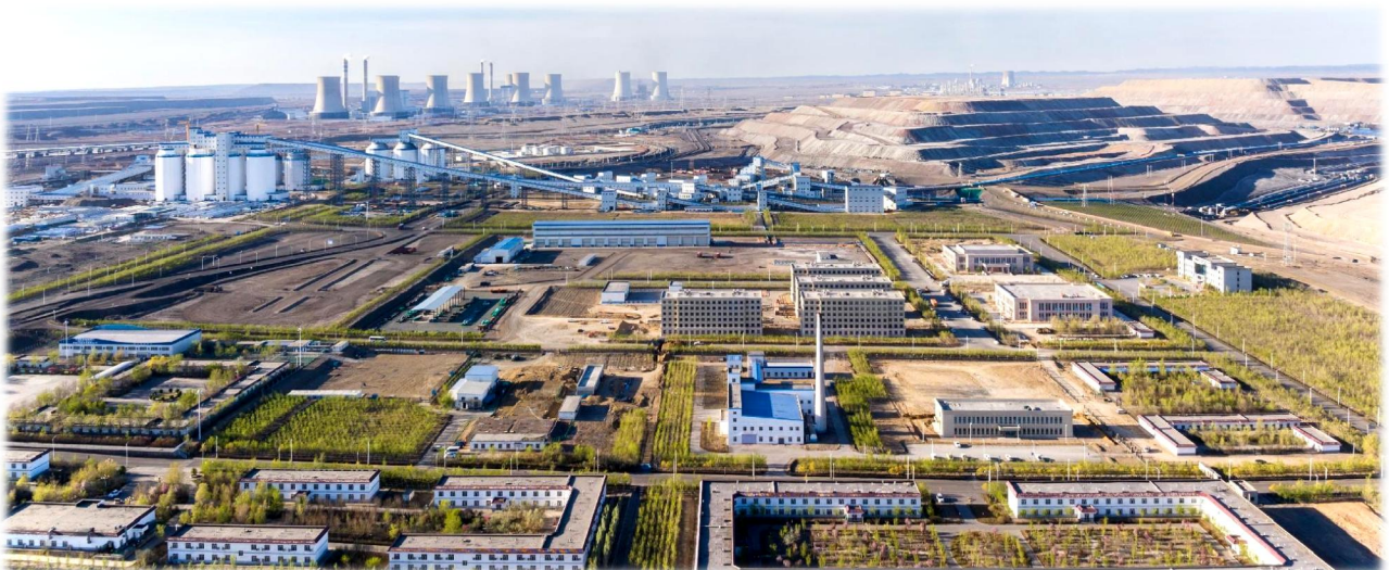
上图：南露天煤矿园区全景图