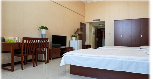
上图：食宿环境（商务区及项目公司）