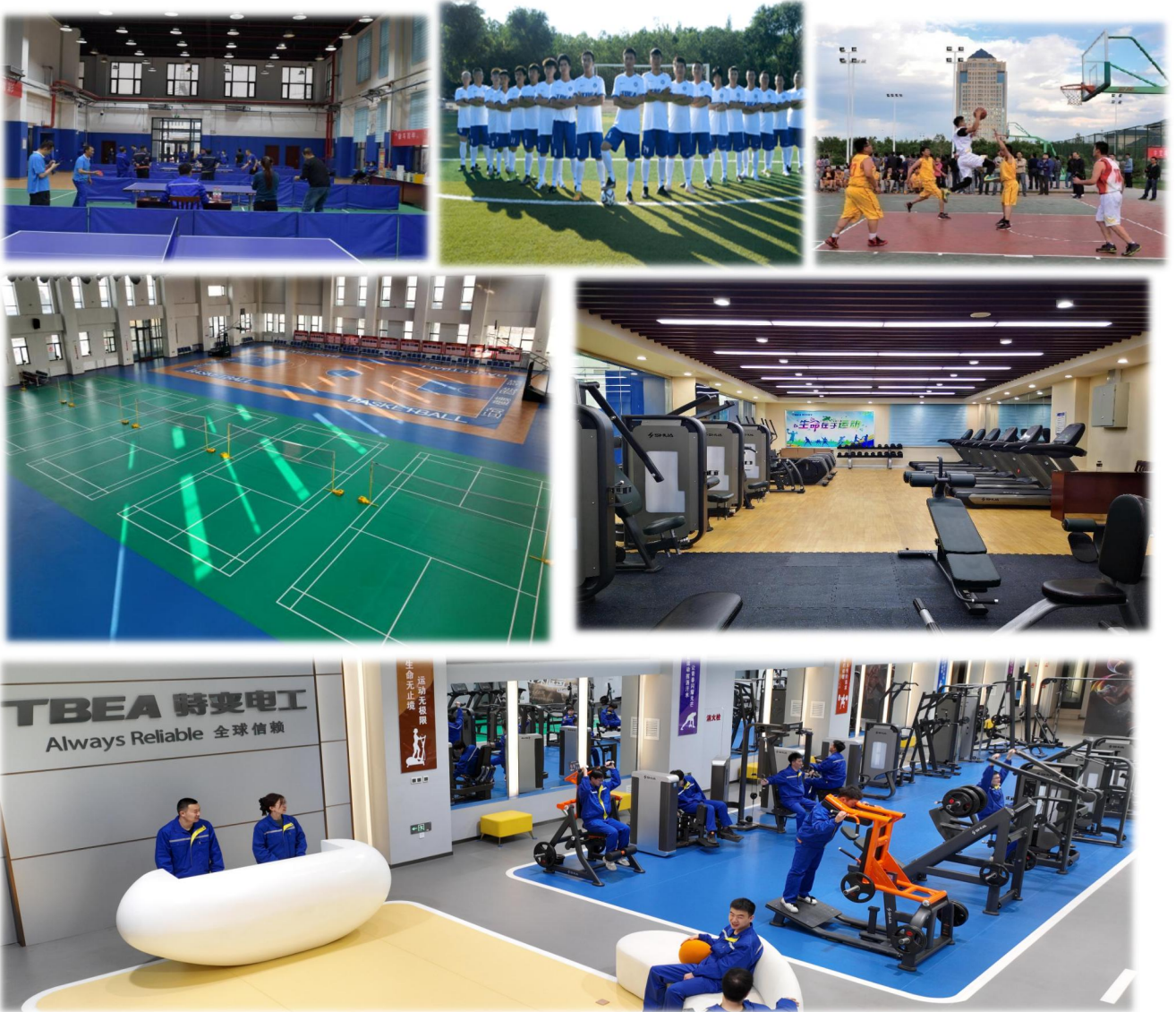
上图：室内健身、运动场所（羽毛球、篮球、乒乓球）