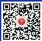
学校官方微信公众账号