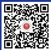
就业处官方微信公众账号